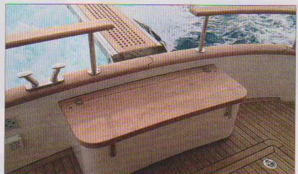
Le cockpit aux formes arrondies reçoit une banquette-coffre.

En plus du capian, symbole des bateaux méditerranéens, la plage avant est équipée de porte-pare-battage très pratiques.